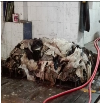
Foto No.3 materia prima pieles crudas