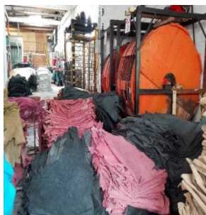
Foto No. 5 Bombos paletéo