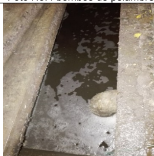
Foto No. 6 Rejillas con agua residual no doméstica.