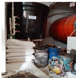
Foto 10 No. Tratamiento agua residual no domestica