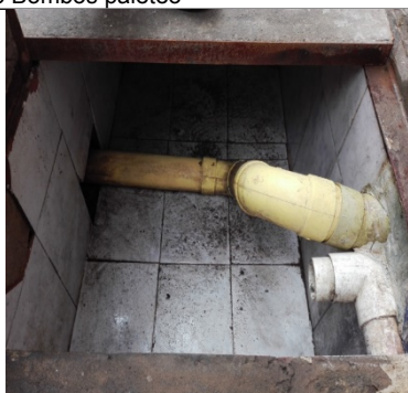
Foto No. 7 caja externa