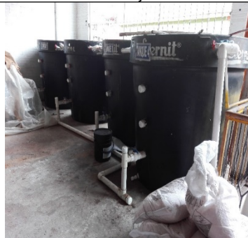
Foto No. 9 Procesos tratamiento agua residual no