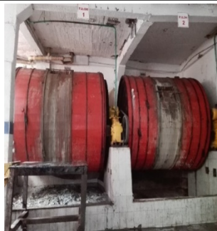
Foto No.4 bombos de pelambre